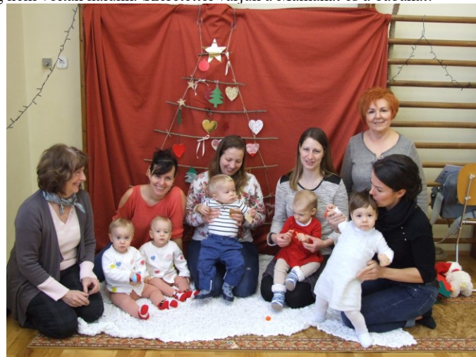
Karácsonyi fotózás a Baba-Mama klubban

Decemberi programjaink között szerepelt a közös kézműves foglalkozás, karácsonyfa készítés és a karácsonyi babafotózás. Január hónapban baba masszázs tanfolyam indítását, továbbá gyermek elsősegélynyújtó bemutató foglalkozást is tervezünk. Arra törekszünk, hogy olyan programokat állítsunk össze, amelyek érdeklik a mamákat, várjuk a kezdeményező ötleteiket. Engedjék meg, hogy ezúton is megköszönjük a Klebelsberg-telepi Polgári Kör Egyesület támogatását, hiszen enélkül nem tudtuk volna megvalósítani programjainkat. Bízunk benne, hogy e sorok olvasva azok a kismamák is kedvet kapnak, hogy eljőjenek hozzánk, akik esetleg még nem voltak nálunk. Szeretettel várjuk a Mamákat és a babákat!