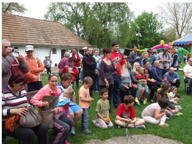
A programon körülbelül 400 fő vett részt.

Ezután következett a főzőverseny eredményhirdetése: három kategóriában hirdetett győztest a zsűri. Karate bemutatót láthattak az érdeklődők, az Összefogás Házában működő karatésok jóvoltából. Volt botos bemutató, harc és cseréptörést is láthattunk. Sörivő verseny folyt a színpad előtt, a szerencsés nyertes egy szép korsóval gazdagodott. A színpadi programok mellett állandó programokkal is vártuk a telep apraja-nagyját: szebbnél szebb formák és képek kerültek a gyerekek arcára, kezére az arcfestők jóvoltából, a Faházban anyák-napi kézművessel várták a kicsiket és nagyokat, illetve a rovásírás rejtelseibe is betekintést kaphattak az érdeklődők! Természetesen nem maradhatott el a forgó és az ugrálóvár sem a programok sorából! A délelőtti folyamán a versenyzőkkel együtt süttött, főzött a „Reneszánsz udvar” is, korhű ételekkel.