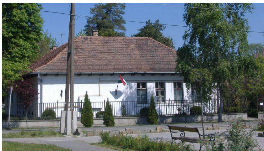
„Összefogás Háza” – Szeged Klebelsberg-telepi Közösségi Központ

Rendezvényeinket támogatja SZEGED MEGYEI JOGÚ VÁROS ÖNKORMÁNYZATA